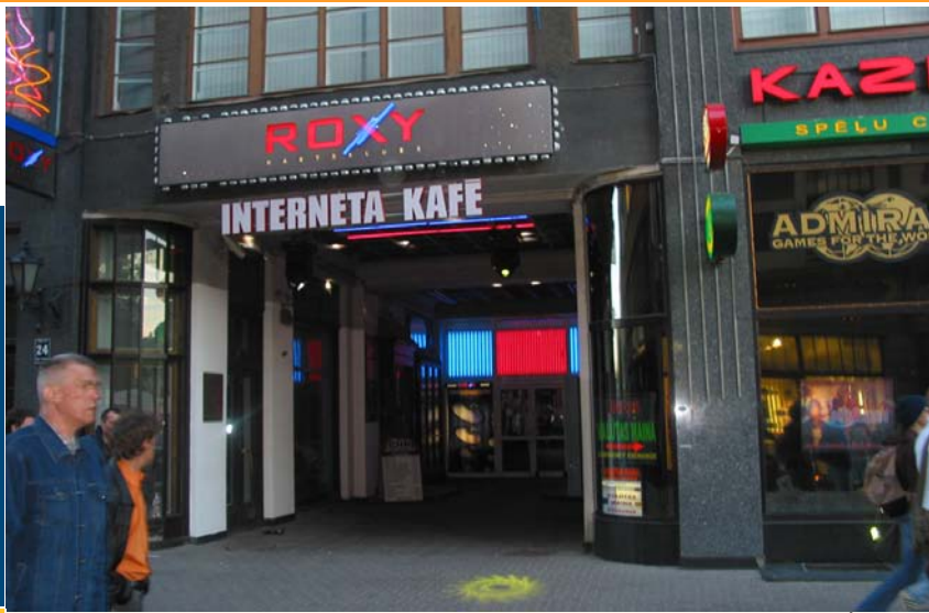
Internetcafé in Riga