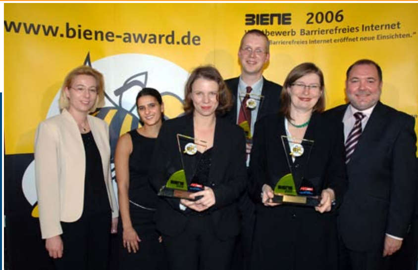
Die Preisträger der BIENE 2006 in der Kategorie "Komplexe Einkaufs- und Transaktionsangebote": DSL Bank, HELP und Thüringer Aufbaubank.