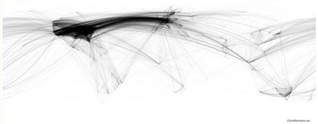
Internet city-to-city connections worldwide © Chris Harrison, Human-Computer Interaction Institute, Carnegie Mellon University