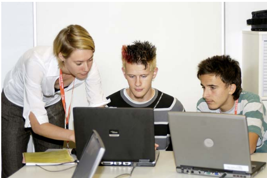
Jugendliche probieren den IT-Fitness-Test im Rahmen des Workshops Surfen, Chatten, Mailen - Sind Jugendliche heute fit für die Arbeitswelt von morgen?

Call for Mails: Erfahrungen und Erlebnisse von Eltern zum 'Zeitfresser Computer'