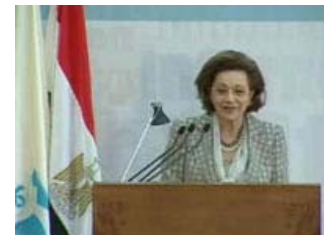
Suzanne Mubarak bei der Eröffnungsrede zur Konferenz

An der zweitägigen Konferenz nahmen insgesamt rund 600 Jugendliche, Eltern und Repräsentanten von Wissenschaft, Wirtschaft, Regierung, Polizei, Wohlfahrtsorganisationen und Medien teil. Die Konferenz sollte auch einen Beitrag leisten zur Vorbereitung des Internet Governance Forum, das im Dezember 2009 in Ägypten stattfinden wird.