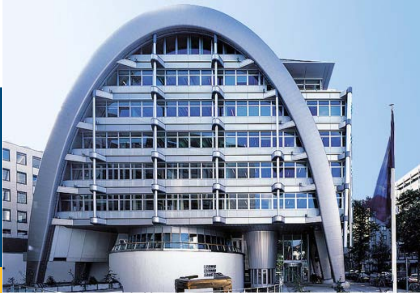
Youth Protection Roundtable - ein europäischer Ansatz zur Verbesserung des Jugendmedienschutzes, 3. April 2009, Berlin